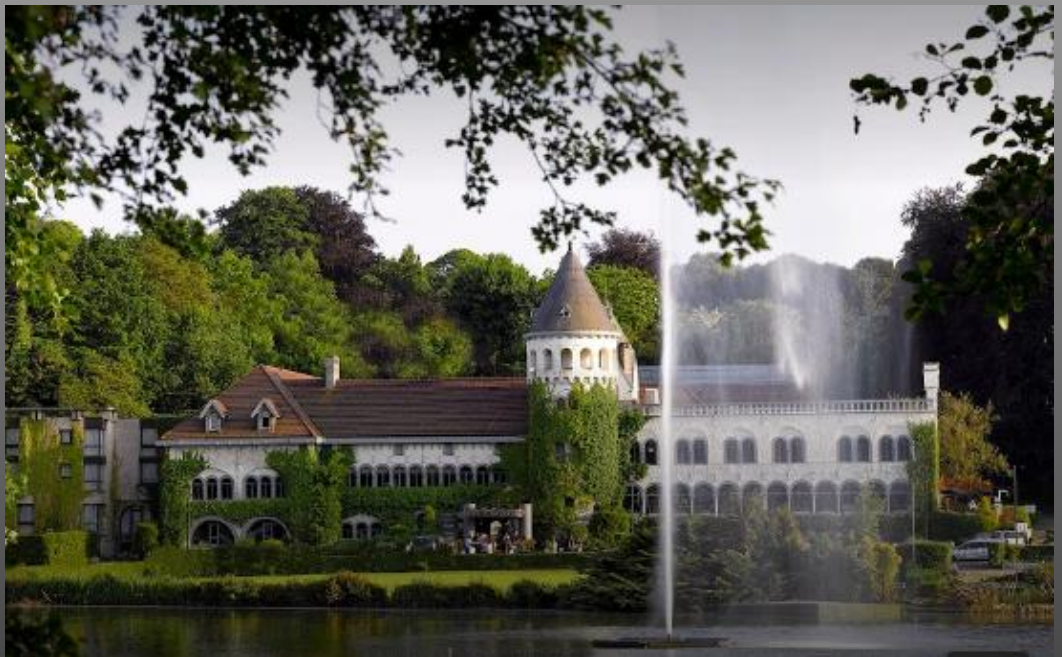
Château du Lac - Genval

Il est évident que 'Planifier' - d'une manière sérieuse - n'est facile pour personne. Mais, il semble sensé de dire que si vous ne connaissez pas - au moins - les 'Incontournables à connaître' pour avoir une possibilité réelle de planifier alors, cela devient réellement très difficile. Il est donc essentiel de répertorier ces 'Incontournables'. Les résultats sont en ligne directe avec la mauvaise planification de départ.